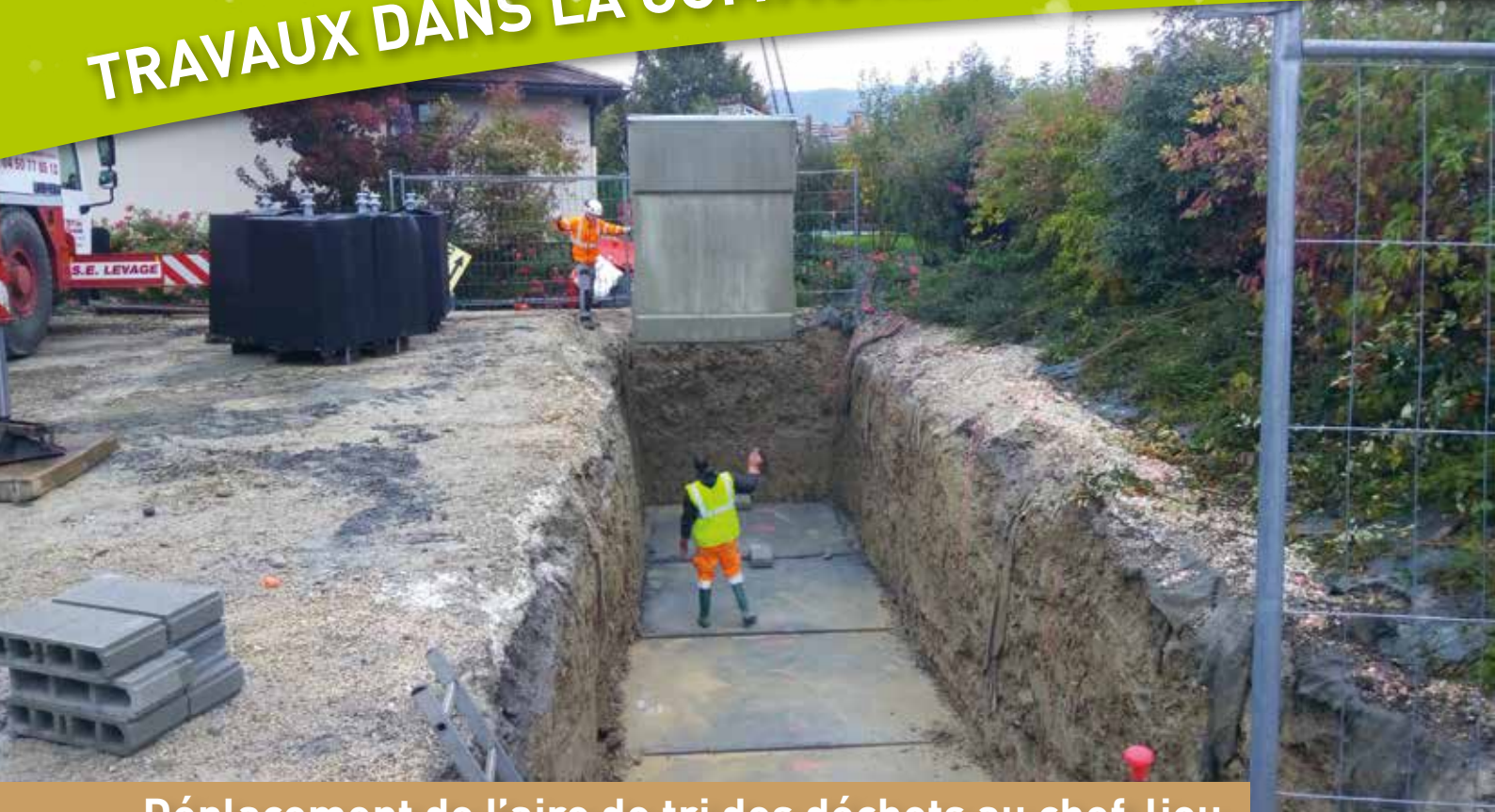
Déplacement de l'aire de tri des déchets au chef-lieu