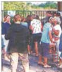
Un moment de convivialité qui a permis surtout aux nouveaux parents de faire connaissance et créer des liens.