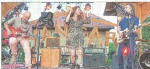
Le groupe MIELE, sur une table de fond pop, où guitares acoustiques et électriques s'entremêlent avec délicatesse, a proposé des chansons explorant mille et une tentatives, oscillant entre profondeur et légèreté.

La restauration proposée sur place était locale, bio et faite maison, et les bois-